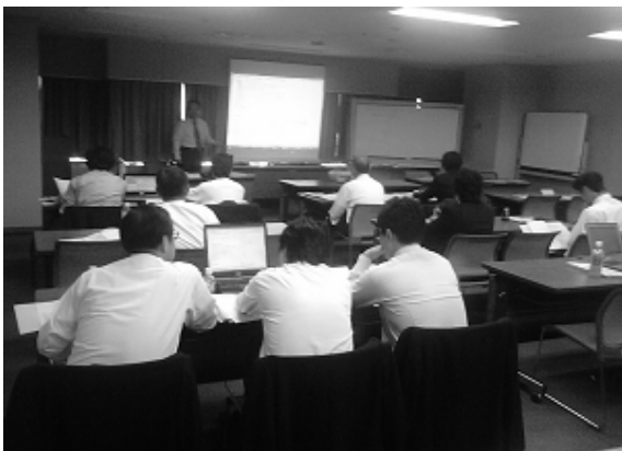
関経連のグリーン化プログラム

大阪市との協働として、大阪市環境経営推進協議会の事務局運営やなにわエコ会議の“環境に配慮した企業部会”への参画にも積極的に取り組みます。