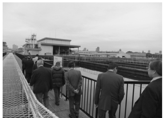
【 柴島浄水場見学会 】