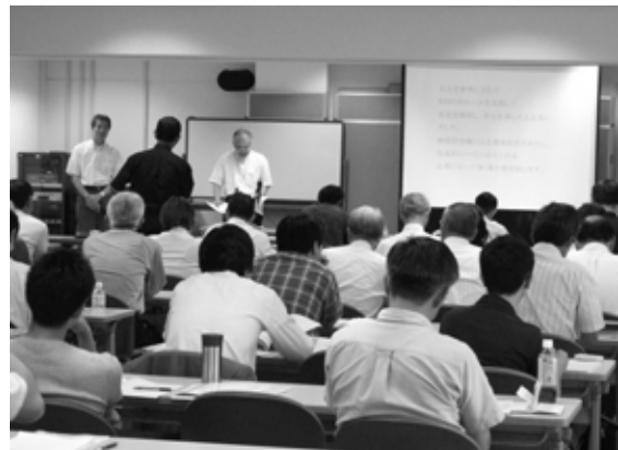
E A 21普及セミナー