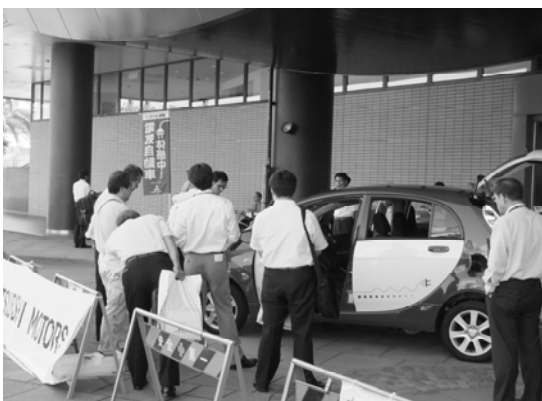
【 電気自動車試乗会 】